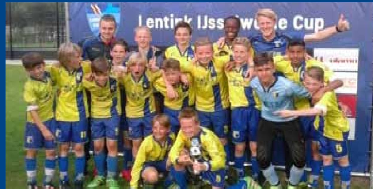
D-1 Kampioen 2015 - 2016

Terugkijkend op het seizoen 2015 – 2016 moet helaas worden geconcludeerd dat de Prestatiesport niet de gewenste ontwikkeling heeft doorgemaakt. Op organisatorisch gebied zijn wel de nodige stappen gemaakt, maar helaas zijn die op het veld niet allemaal in prestaties vertaald. Wel is er de overtuiging dat de goede weg wordt bewandeld en dat ondanks dat de gestelde doelstellingen niet allemaal gerealiseerd zijn in de periode die vooraf gepland was, deze op afzienbare tijd alsnog worden gerealiseerd.