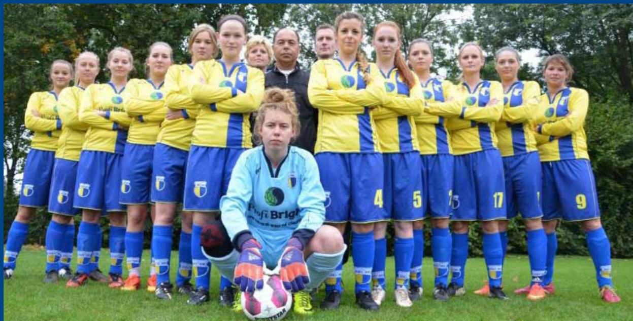
Kampioenschap vrouwen 1 seizoen 2015 - 2016